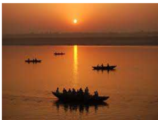
ガンジス河の日の出(イメージ)

旅行代金 342,000 円 (成田空港発着・7名様以上ご参加の場合) 322,000 円 (成田空港発着・9名様以上ご参加の場合) 307,000 円 (成田空港発着・11名様以上ご参加の場合)