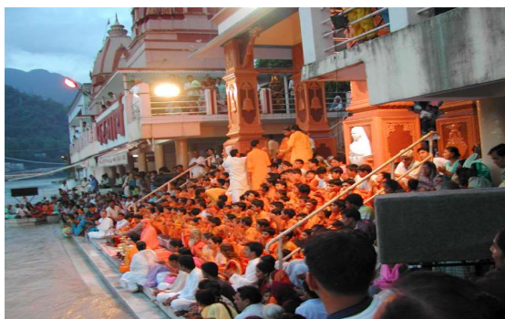
アルティお祈り儀式(リシケシ)