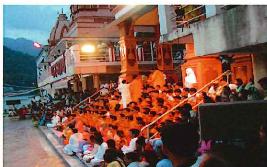
アルティお祈り儀式(リシケシ)

旅行代金 342,000 円 (成田空港発着・7名様以上ご参加の場合) 322,000 円 (成田空港発着・9名様以上ご参加の場合) 307,000 円 (成田空港発着・11名様以上ご参加の場合)